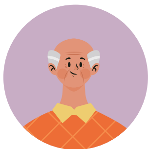
Generación Baby Boomer 56-75 AÑOS 55% 79% 86% 63%

Es importante darse cuenta lo fundamental que son las redes sociales y cómo podemos sacarles provecho para hacer que la experiencia de compra sea más sencilla y segura para los usuarios.