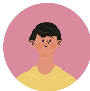
Generación Y - Milenials 31-43 AÑOS 55% 79% 86% 63%