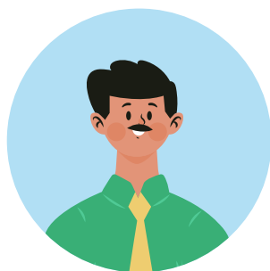
Generación Xennials 44-55 AÑOS 55% 79% 86% 63%