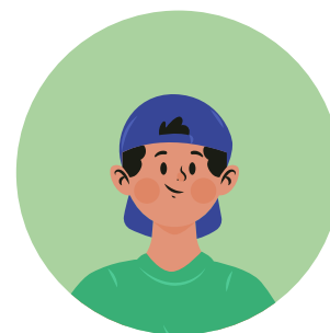
Generación Z 14-30 AÑOS 55% 79% 86% 63%